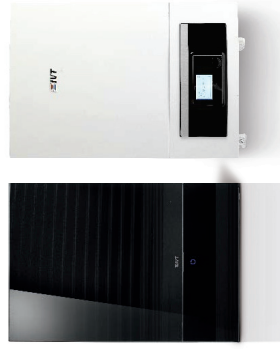
Inmedel utan värmvattenberedare. Glasfront i svart eller vit design. Finns även i standardutförande med plåtfrott.

Styrsystemet Rego 2000 ® gör att du inte behöver bry dig om värmepumpens inställningar mer än du själv vill. Det intelligenta styrsystemet anpassar driften helt på egen hand utifrån ditt hus värmebehov. Vill du göra egna justeringar har du enkel tillgång till alla inställningar du behöver. Appstyrningen IVT Anywhere låter dig också övervaka och styra värmepumpen direkt i din smartphone. Värmepumpen kan även samköras med solfångare.